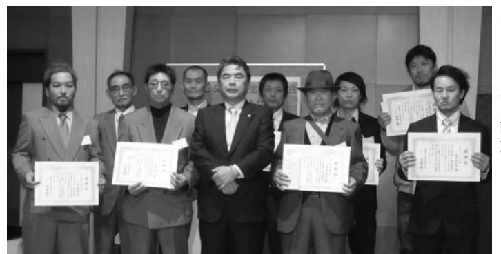
優秀技能士表彰者