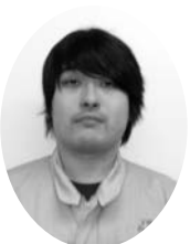
②㈱ヤブサダイナミックス