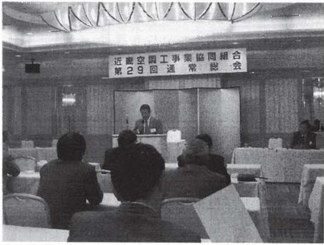
第29回通常総会(大阪東急ホテルにて)